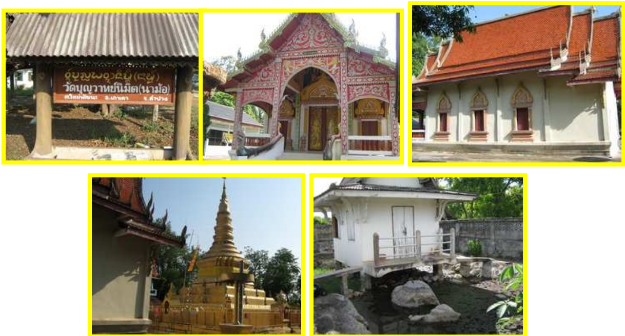
จัดทำโดย นายพรพงษ์ เกตุชัยโกศล ครูศูนย์การเรียนรู้ตำบลใหม่พัฒนา