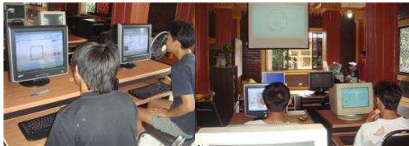
หลักสูตรระยะสั้นอบรมคอมพิวเตอร์