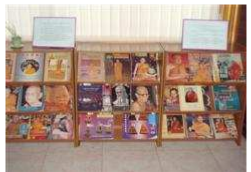
มุมหนังสือธรรม