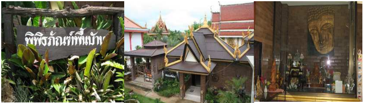
พิพิธภัณฑ์พื้นบ้าน