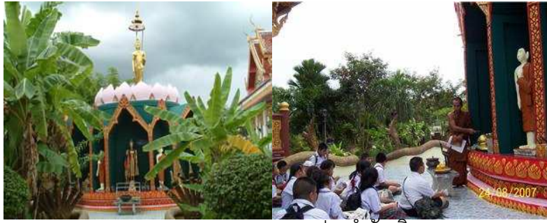
พระประจำวันเกิด