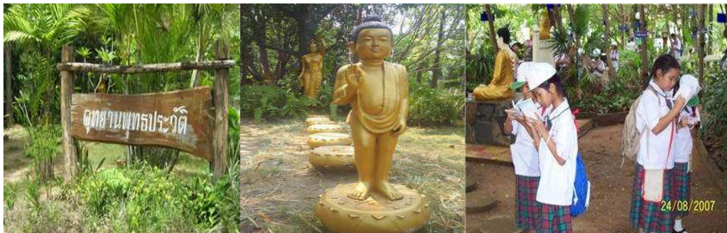
ศึกษาข้อมูลอุทยานพุทธประวัติ