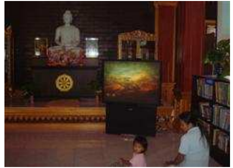
ชมวีดิทัศน์ ฯ เพื่อความรู้