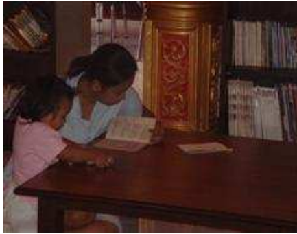
ศึกษาค้นคว้า