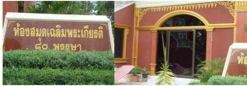
ห้องสมุดเฉลิมพระเกียรติ 80 พรรษา