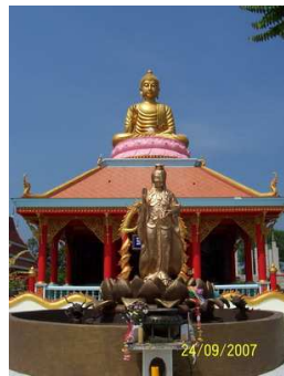
วิหารพระโพธิสัตว์