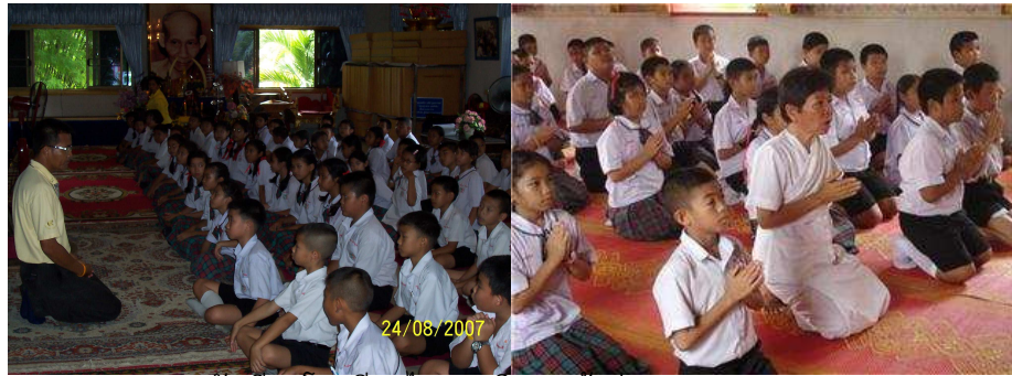
นักเรียนโรงเรียนตฤภพวิทยาเข้าค่ายอบรมธรรม

แหล่งเรียนรู้วัดสันตินิคมตั้งอยู่ ณ เลขที่ 142 หมู่ที่ 2 บ้านสันป่าสัก ตำบลใหม่พัฒนา อำเภอเกาะคา จังหวัดลำปาง เป็นสถานที่ในการเผยแพร่และอบรมคุณธรรม และจริยธรรม มีการอบรมและปฏิบัติธรรมทั้ง อุบาสกและอุบาสิกา เป็นสถานที่ในการอบรมและบรรยายของหน่วยงาน คณะครู อาจารย์และนักเรียนนักศึกษา รวมถึงการมาเข้าค่ายอบรมธรรมของหน่วยงานและสถานศึกษาต่าง ๆ เป็นสำนักปฏิบัติธรรมแห่งหนึ่งของ จังหวัดลำปาง (ในทั้งหมด 4 แห่ง ) เป็นอุทยานการศึกษาทั้งทางโลกและทางธรรม มีแหล่งเรียนรู้พุทธประวัติ ใหว่พระจำวันเกิด สวนสมุนไพรรักษาโรค พิพิธภัณฑ์พื้นบ้าน วิหารพระโพธิสัตว์ ศาลาประกอบบุญ อุโบสถ และห้องสมุดให้ทำการศึกษาค้นคว้าและอบรมหลักสูตรระยะสั้นการอบรมคอมพิวเตอร์ และบริเวณ ด้านบนของห้องสมุดในอนาคต ขณะนี้กำลังดำเนินการก่อสร้างวิหารบูรพณาจารย์ เป็นแหล่งรวบรวมรูปเหมือน ของ บูรพณาจารย์ ที่ทุกคนเลื่อมใสศรัทธา และยังเป็นศูนย์ประสานงานสภาเด็กและเยาวชนของหมู่บ้านสันป่า สัก และจะพัฒนาเป็นเป็นศูนย์ประสานงานสภาเด็กและเยาวชนของตำบลใหม่พัฒนา