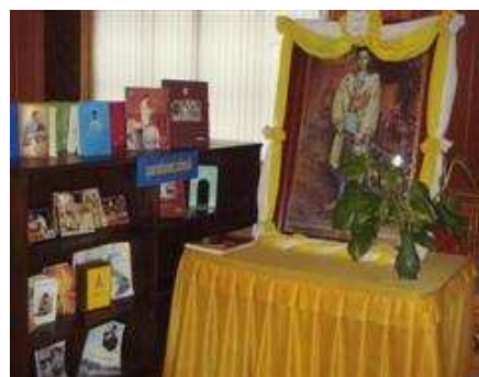
มุมเฉลิมพระเกียรติ