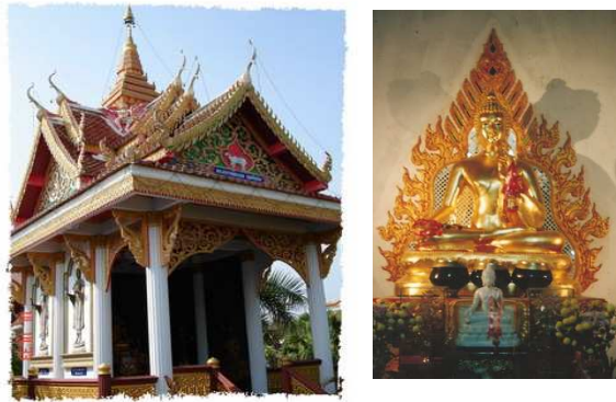
มณฑปพระเจ้าทันใจ