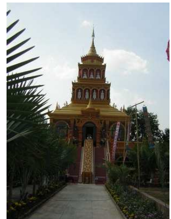
วิหารบูรพาจารย์