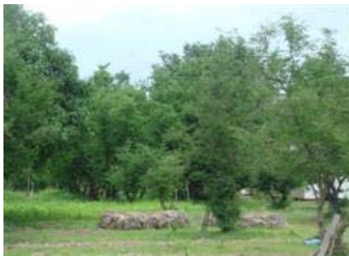
สวนมะขาม