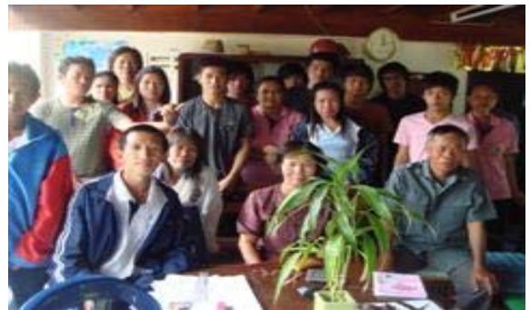
นักศึกษา กศน. มาศึกษาดูงานเรื่องเศรษฐกิจพอเพียง