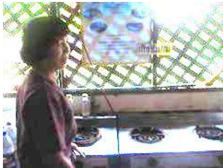
การประกอบอาหาร โดยใช้ก๊าซชีวภาพจากมูลสุกร

เลี้ยงสุกร โดยมูลสุกร ลงบ่อพักแล้วนำมาผลิตเป็นก๊าซชีวภาพใช้ในการประกอบอาหาร