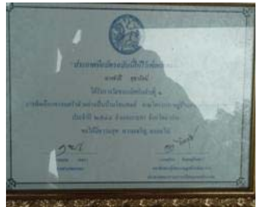
รางวัลชนะเลิศอันดับ 1 การคัดเลือกครอบครัว โฮมสเตย์ ตามโครงการหมู่บ้าน OTOP ปี