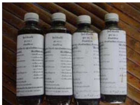
ทำปุ๋ยน้ำชีวภาพใช้ในการเกษตรและจำหน่าย