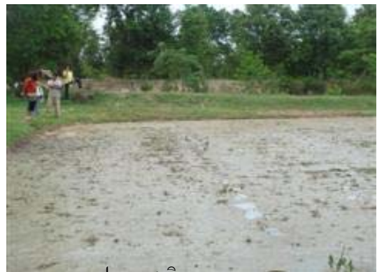
แปลงนาสาธิต