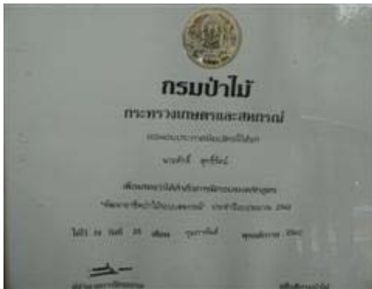
กรมป่าไม้ กระทรวงเกษตรและสหกรณ์ พัฒนาอาชีพป่าไม้ ตัวอย่าง ระบบสหกรณ์ ประจำปี 2542 2548