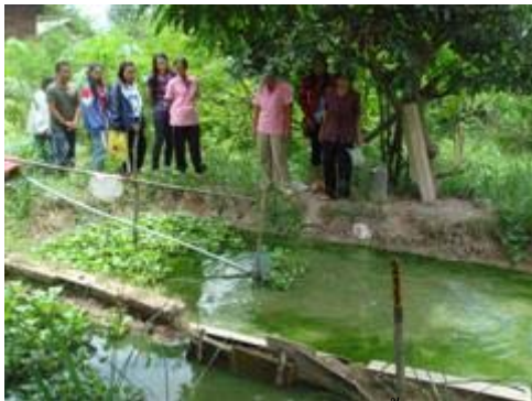
สระสำหรับเลี้ยงปลาตุ๊ก