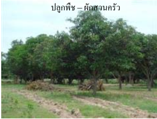
สวนมะขาม