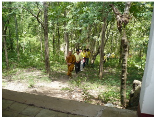
พระอริการชรด อริโย เจ้าอาวาสวัดพระธาตุคายน้อย นำนักศึกษาเดินชมรมยาตราบริเวณรอบวัดคายน้อยจำนวน 3 รอบ