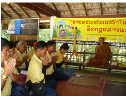
พระอริการชรด อริโย เจ้าอาวาสวัดพระธาตุดอยน้อย นำนักศึกษากล่าวอธิษฐาน ก่อนเดินธรรมยาตรา