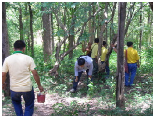
นักศึกษาช่วยกันปรับเส้นทางเดินจงกรมรอบ ๆ บริเวณวัดพระธาตุดอยน้อย