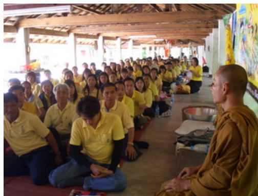
พระอริการชรด อริโย เจ้าอาวาสวัดพระธาตุดอยน้อย ได้บรรยายธรรมะให้กับนักศึกษา