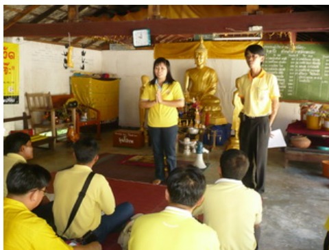
ตัวแทนนักศึกษาสาธิตวิธีการเดินจงกรม