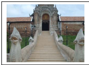
บันไดนาค

บันไดนาค และ ชุ่มประตู่โขง เป็นบันไดทางขึ้นสู่ วัดพระธาตุลำปางหลวง ราวบันไดทำด้วยหัวนาคเลื้อยสอง มาจากบนเขาถึงสองตัว ตัวหนึ่งมาหยุดโผล่เศียรที่ช่วงกลางของบันได เบื้องล่าง บางคนมองเห็นเป็นบันไดนาคสองชั้น ชั้นหัวนาค ชั้นล่างเป็นมกรคายนาค ชั้นที่สองเป็นหัวนาคหัวเดียว ที่ปลายสุดของบันไดทางขึ้นเป็นชุ่มประตู่โขง ลักษณะเป็นรูปปราสาทมียอดแหลมพุ่งขึ้นไปเป็นชั้นๆ ลดหลั่นกันมาเป็นชั้นๆ มีลายปูนปั้นเป็นนาคและหงส์ตามชั้นต่างๆ หน้าบันของชุ่มนี้ ประดับลายปูนปั้นเป็นตราธรรมจักรขนาดใหญ่